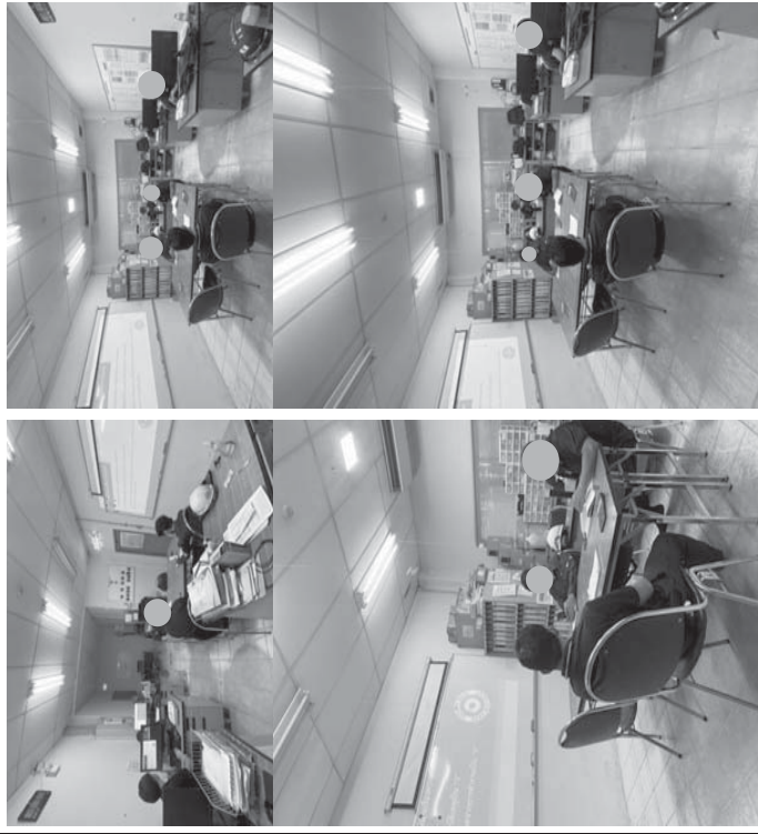
หน่วยงานความปลอดภัย